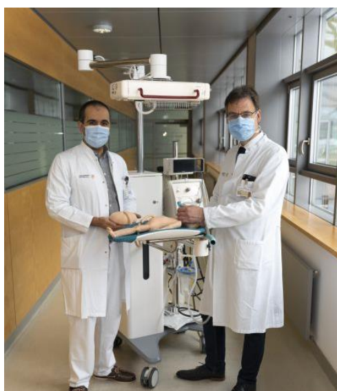
PD Birdir und Prof. Rüdiger demonstrieren den neuen Erstversorgungstisch